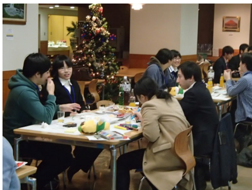
意見交換はリラックスした雰囲気です...